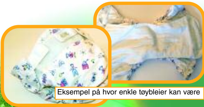
Eksempel på hvor enkle tøybleier kan være